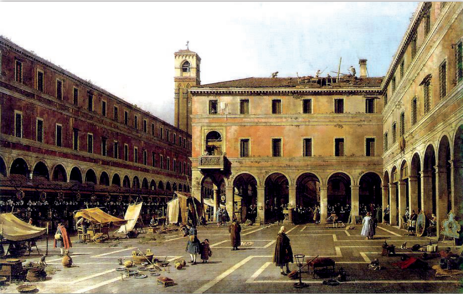
Il Campo di Rialto, Canaletto 1756, Gemäldegalerie, Berlin

RE-INGEGNERIZZAZIONE DELLA PREVENZIONE INDIVIDUALE E PROGRAMMI DI SCREENING: EFFICACIA, QUALITÀ E SOSTENIBILITÀ