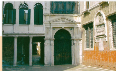
Venezia – Scuola Grande San Giovanni Evangelista Esterno

IOV – Istituto Oncologico Veneto Regione Veneto